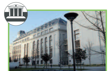
Une nouvelle université