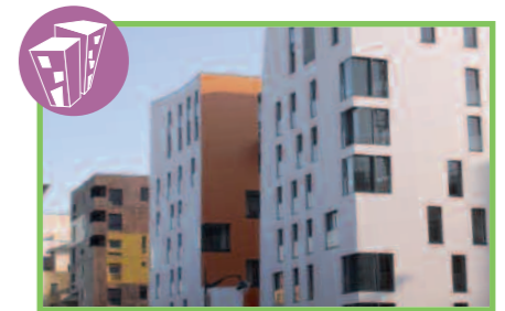
51 immeubles de logements acquis ou construits