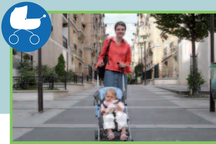
12 crèches supplémentaires (ouvertes ou en construction)