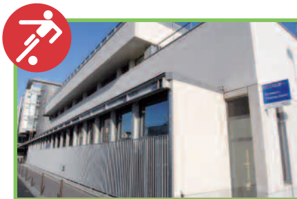
6 nouveaux équipements sportifs