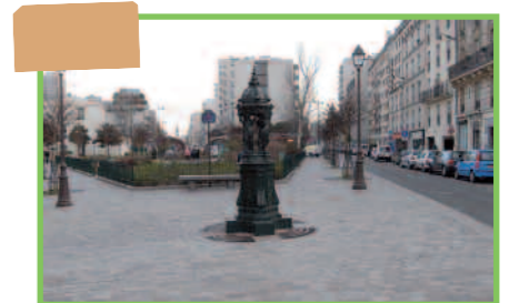
Une centaine de rues réaménagées

Et aussi : deux nouvelles lignes de bus, la station Olympiades de la ligne 14, la plupart des stations de métro rénovées, la Maison des Associations, un centre socio-culturel, des Antennes-jeunes, deux établissements publics numériques, des centaines de plantations d'arbres, des aménagements et des équipements pour les personnes handicapées.