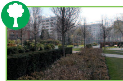
13 nouveaux jardins pour le 13 e