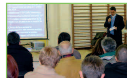
8 Conseils de quartier